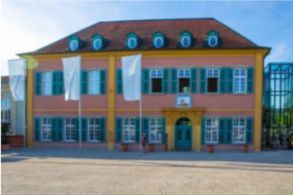
Veranstaltungsort: Palais Hirsch

Im März fand in Heidelberg das Finale des internationalen Liedwettbewerbs "Das Lied" statt. Einer der weltweit wohl renommiertesten Veranstaltungen für junge Sängertalente. Vorsitz der Jury hatte Thomas Quasthoff.